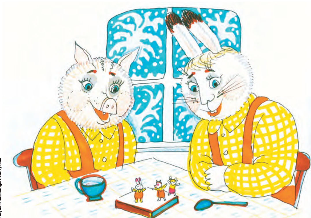
Рисунок Александра Лепетухина

– Ну конечно! Это сказка про морковку. Ты вырастил оранжевую морковку, потом продал её на рынке и купил красную машину. Нравится?