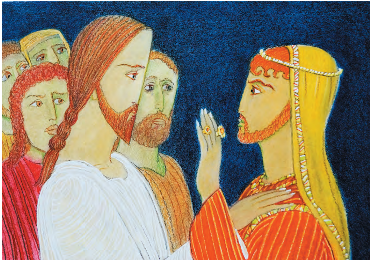
А. ЛЕПЕТУХИН. Христос и Богатый юноша

Увы – это оказалось юноше не по силам. Не потому, наверное, что