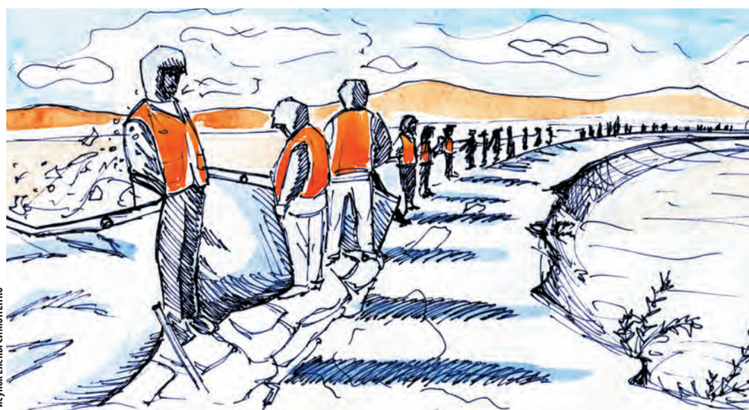
Рисунок Елены СИМОНЕНКО

Но мне в сердце запала другая картина, которую я наблюдала лично. Было это примерно там же, со стороны микрорайона Мылки, что находится на въезде в город. Только с этого берега можно оценить масштаб битвы