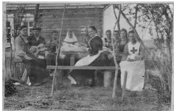
Сестры милосердия. Из хабаровского альбома нижегородского отряда