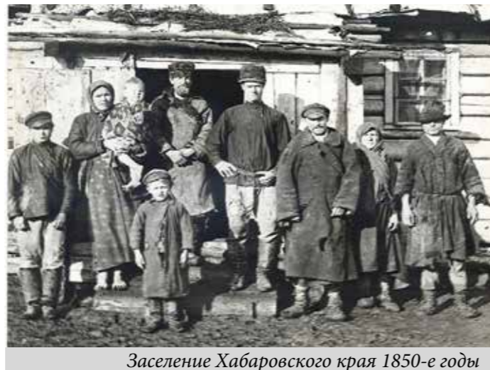
Заселение Хабаровского края 1850-е годы