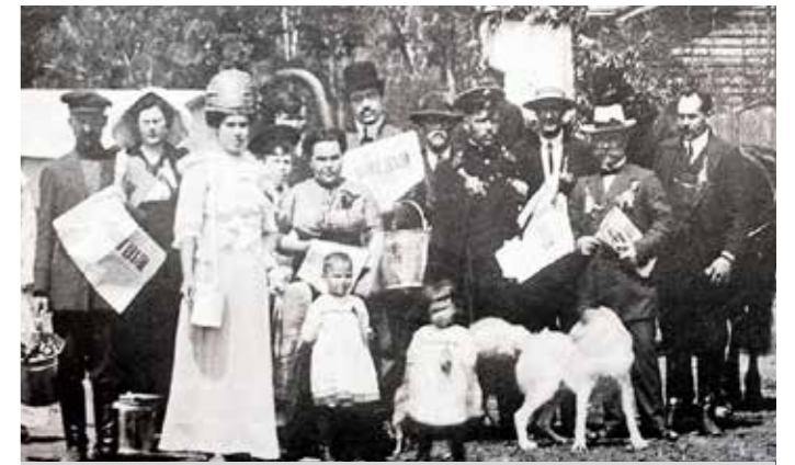
Праздник Белого цветка в Хабаровске. На нем собирали деньги для больных туберкулезом