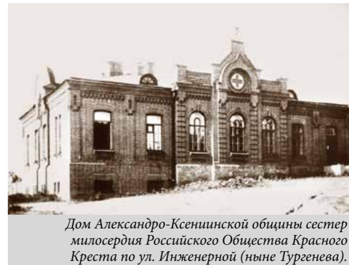
Дом Александро-Ксенинской общины сестер милосердия Российского Общества Красного Креста по ул. Инженерной (ныне Тургенева).