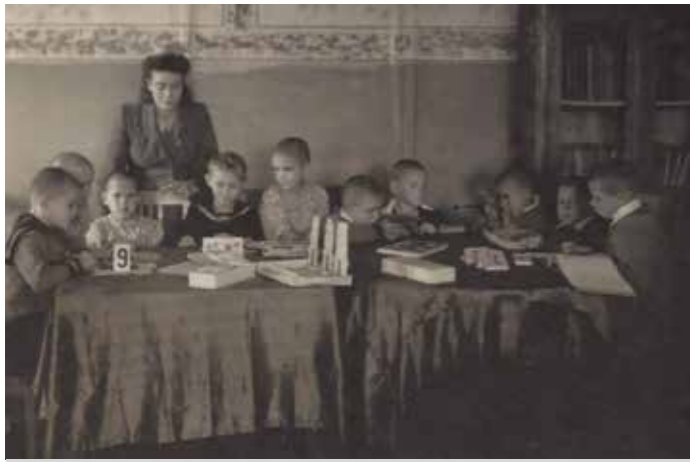
Ольгинский детский приют трудолюбия